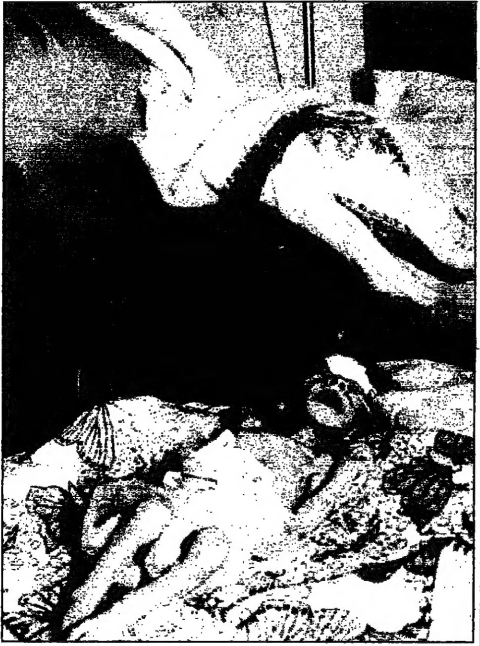
احد افراد البعثة الاماراتية يزور مستشفى صدام

وقال الشيخ حمد بن عيسى آل ثاني، إن اللجنة الخليجية للوساطة التي تشكلت في 1996م لم تتمكن من حل النزاع الحدودي بين قطر والبحرين، مؤكداً أن اللجنة لم تف بواجبها في تهدئة التوتر بين الطرفين.